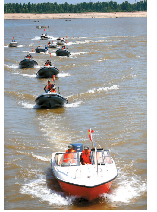
6月21日,山东青岛即墨区防汛应急救援志愿者在挪城水库进行冲锋舟水上编队防汛演练。

据新华社北京6月21日电 据国家卫生健康委委员会21日通报,6月20日0—24时,31个省(自治区、直辖市)和新疆生产建设兵团报告新增新冠肺炎确诊病例26例,其中境外输入病例1例(在福建),本土病例25例(北京22例,河北3例);无新增死亡病例;新增疑似病例3例,均为本土病例(均在北京)。