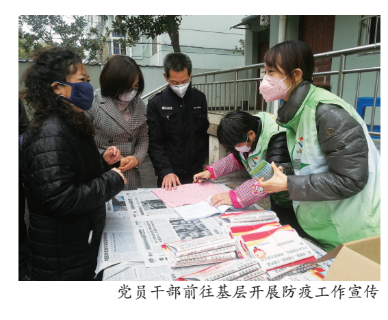
党员干部前往基层开展防疫工作宣传

牢固树立精明增长、紧凑城市理念，以绣花功夫精心描绘城市治理“工笔画”，推动宝山内涵、更富魅力、更添活力。