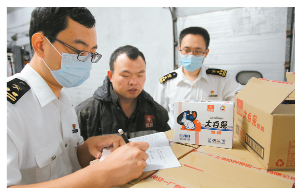
大白兔雪糕开始出口加拿大、澳大利亚等国家。

这一事件引发讨论，网友呼吁中国企业抓紧开发自己的产品。随后，“正身”迅速联手合作方，在今年完成大白兔雪糕的国内上市，又立马着手出口事宜。截至目前，大白兔雪糕已在奉贤海关通关7批次，货值达19.29万美元。据介绍，大白兔雪糕现已顺利出口到加拿大、澳大利亚等国家，今年还将拓展到更多的国家和地区。