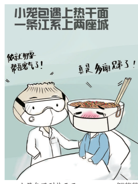
小笼包遇到热干面。 邹芳草