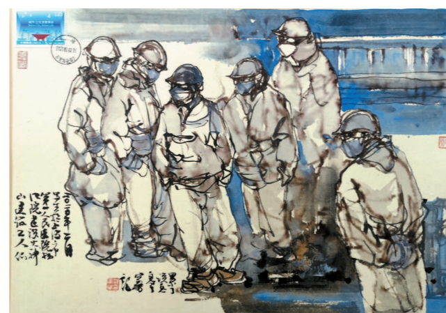
城市血液仍在流动。