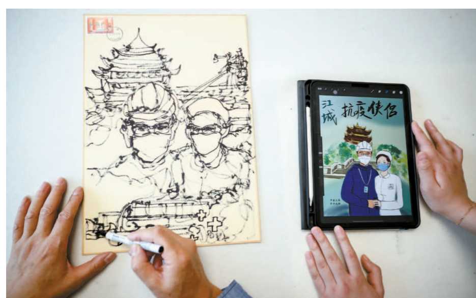
两代画家以武汉一对抗疫伉俪为题材进行“同题创作”。