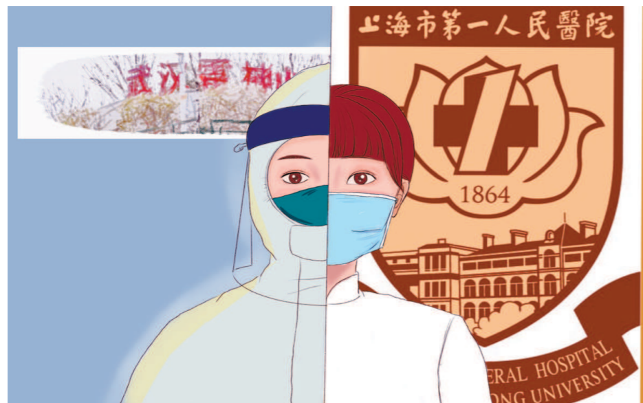
“我赴江城，君守申城，共克时艰”。