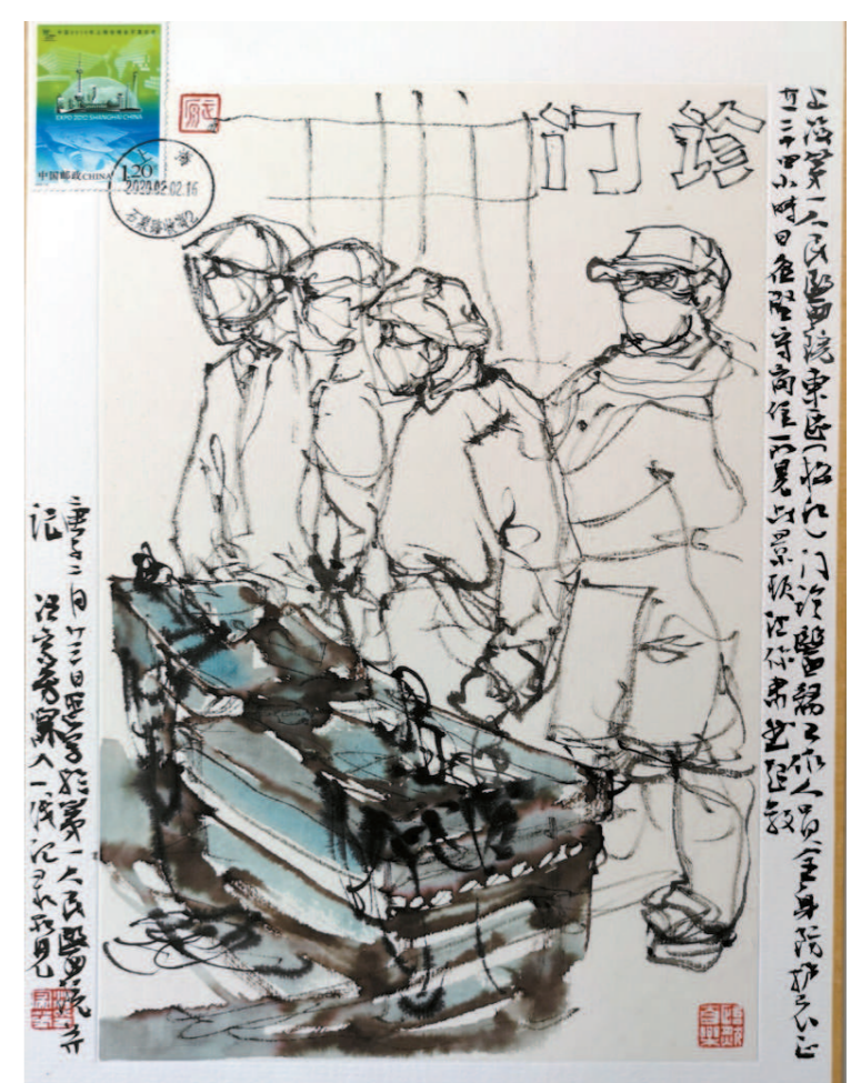
门诊间的神秘力量。