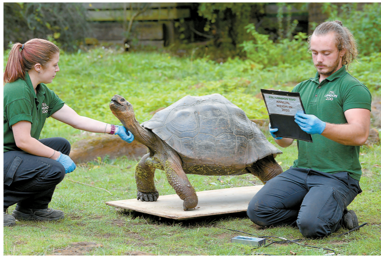
在英国伦敦动物园，工作人员给加拉帕戈斯象龟称重。