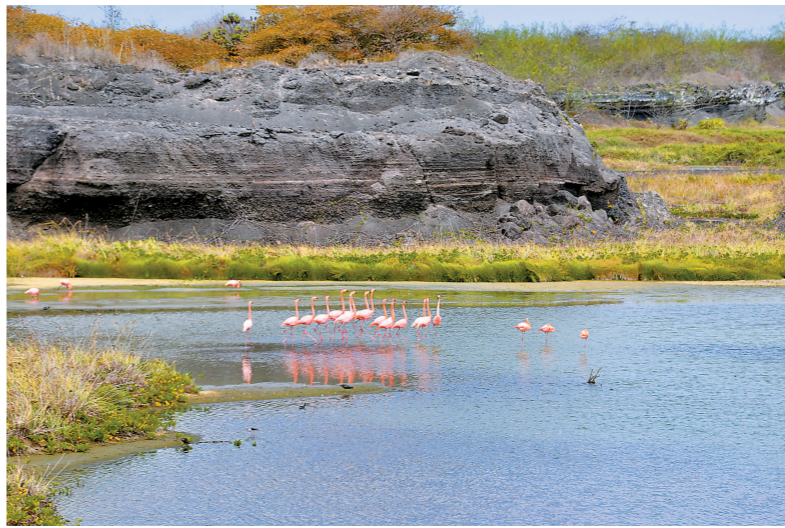
加拉帕戈斯群岛上的火烈鸟。群岛上的动植物物种极其丰富，有“活的生物进化博物馆和陈列室”之称。