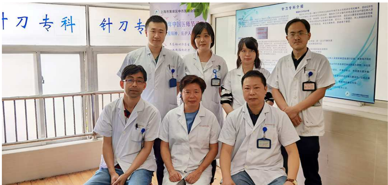
黄浦区中西医结合医院针刀专科人员合影。

在患者用其他保守治疗如外贴膏药、内服药物、推拿、牵引等效果不明显，又无明确手术指征或不愿手术时，针刀疗法为患者提供了另一条出路。近年来，考虑针刀科诊疗疾病主要以中老年人人居多，而中老年人又具有基础疾病较多、行动不便等特点，针刀专科开展了日间住院手术服务，为高龄、有心血管等基础疾病、涉及脊椎等高风险患者提供舒适、安全、便捷、经济的住院医疗服务，努力实现“不拒绝一个患者，为患者解除病痛”的救治目标。