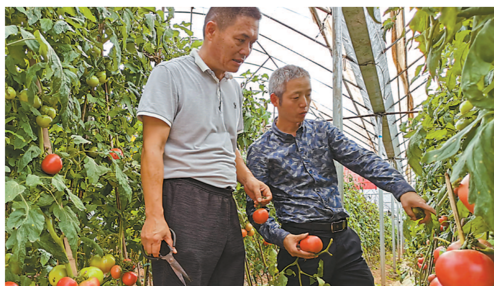
在云南镇沅县的大棚里,“远嫁”过来的上海金奖大番茄进入成熟采摘期。

今年,金山为提高普洱市帮扶县农业科技水平和产业附加值,统一派出援疆农技人才,指导两地农业企业合作开展金山优质蔬果新品种试验、示范、推广。镇沅县恩乐镇优质绿色番茄标准化种植示范项目,引进上海富农种业有限公司培育的5个优良番茄品