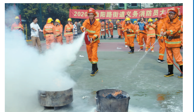
曲阳路街道开展义务消防队培训

社区治理,没有最好,只有更好、更精细。曲阳路街道始终把人民群众生命财产安全作为基层社区治理的首要目标,持续治理、久久为功,街道辖区入室盗窃案数连续3年保持个位数和逐年下降态势,辖区安全感满意度综合排名连续3年全区第一,先后荣获全国安全社区、全国反邪教优秀社区、全国防灾减灾安全示范社区、上海市社会治安综合治理先进集体,是虹口区唯一连续9年荣获上海市“平安示范社区”称号的街道,使住在曲阳社区的百姓真正感受到了安全感、获得感、幸福感。