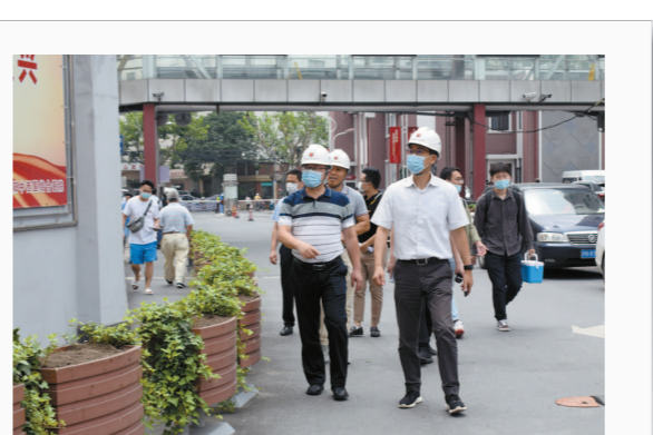
曲阳路街道党政领导带队开展安全生产检查