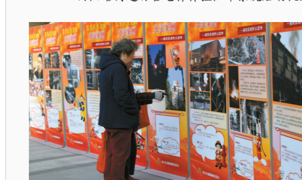
社区老人观看消防安全宣传展