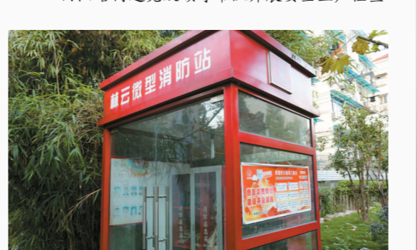
曲阳路街道微型消防站