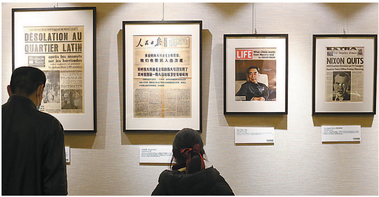
“历史的底稿——十七世纪以来的中外报刊珍藏展”在徐家汇藏书楼开幕,吸引观众驻足观赏。