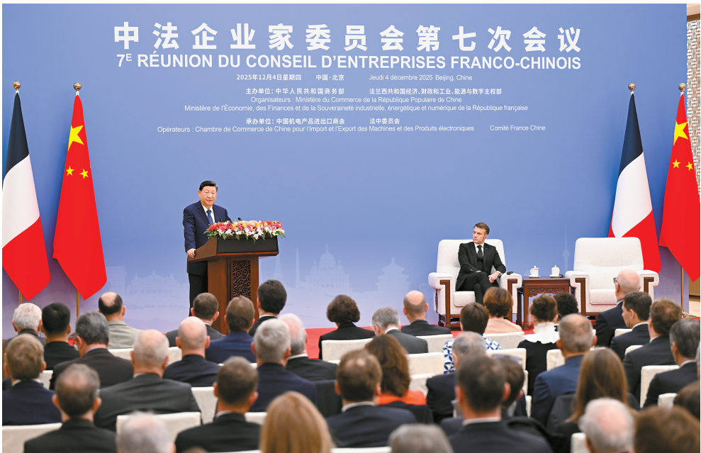
12月4日中午,国家主席习近平在北京同法国总统马克龙共同出席中法企业家委员会第七次会议闭幕式并致辞。

■无论外部环境如何变化,中法两国都应当始终展现大国的战略眼光和独立自主,在彼此核心利益和重大关切问题上相互理解和支持,维护好中法关系的政治基础 ■各国产供应链深度互嵌,开放合作带来发展机遇发展,“脱钩断链”意味着自我封闭。保护主义不能解决世界产业结构调整的问题,反而将恶化国际贸易环境。中欧双方应该坚持伙伴关系定位,秉持开放态度推进合作,确保中欧关系沿着独立自主、合作共赢的正确轨道发展 ■两国元首就乌克兰危机交换意见。习近平指出,中方支持一切有利于和平的努力,将继续以自己的方式为危机政治解决发挥建设性作用。中方支持欧洲国家发挥应有作用,推动构建均衡、有效、可持续的欧洲安全架构