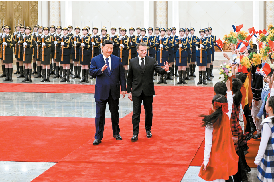
12月4日上午,国家主席习近平在北京人民大会堂同来华进行国事访问的法国总统马克龙举行会谈。这是会谈前,习近平在人民大会堂北大厅为马克龙举行欢迎仪式。

■无论外部环境如何变化,中法两国都应当始终展现大国的战略眼光和独立自主,在彼此核心利益和重大关切问题上相互理解和支持,维护好中法关系的政治基础 ■各国产供应链深度互嵌,开放合作带来发展机遇发展,“脱钩断链”意味着自我封闭。保护主义不能解决世界产业结构调整的问题,反而将恶化国际贸易环境。中欧双方应该坚持伙伴关系定位,秉持开放态度推进合作,确保中欧关系沿着独立自主、合作共赢的正确轨道发展 ■两国元首就乌克兰危机交换意见。习近平指出,中方支持一切有利于和平的努力,将继续以自己的方式为危机政治解决发挥建设性作用。中方支持欧洲国家发挥应有作用,推动构建均衡、有效、可持续的欧洲安全架构