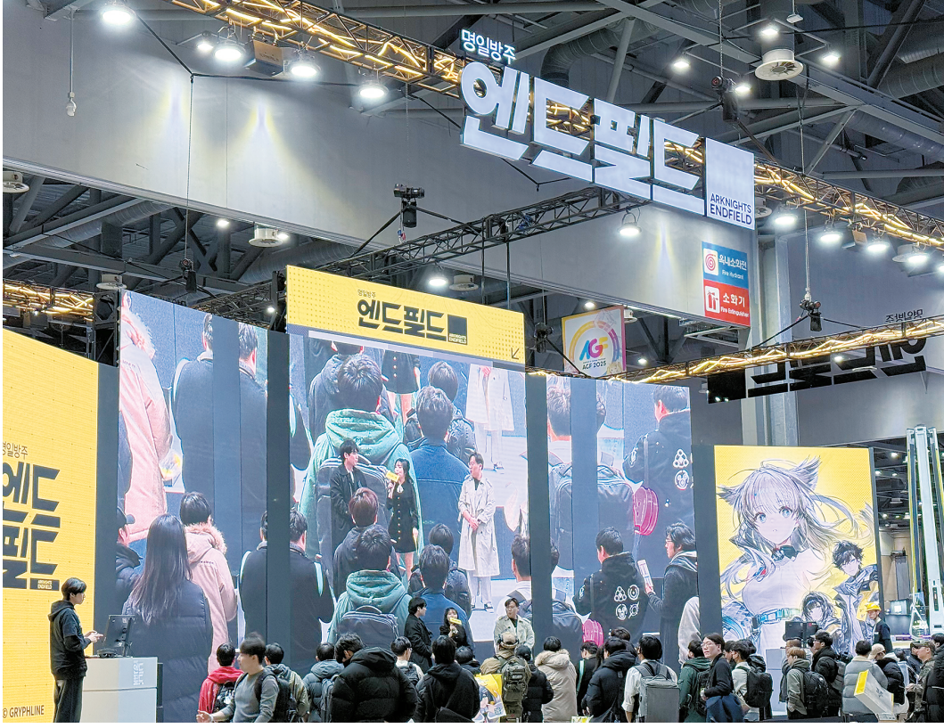
在韩国动漫游戏节上,以五面大型分屏为背景的《明日方舟:终末地》展区十分醒目。

“游戏出海过程中,我们用‘情感共鸣+创新表达’让中国文化元素既保留底蕴,又能被全球玩家自然接纳。”鹰角网络相关负责人介绍,《终末地》中的武陵城,就是践行这一思路的核心案例——我们没有选择海外玩家熟悉的传统古风符号,而是聚焦现代国风的设计方向,去探索未来想象中的东方世界该是什么模样,让