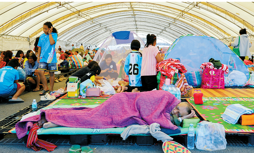
12月8日,人们在泰国边境省份武里南府一处避难所休息。