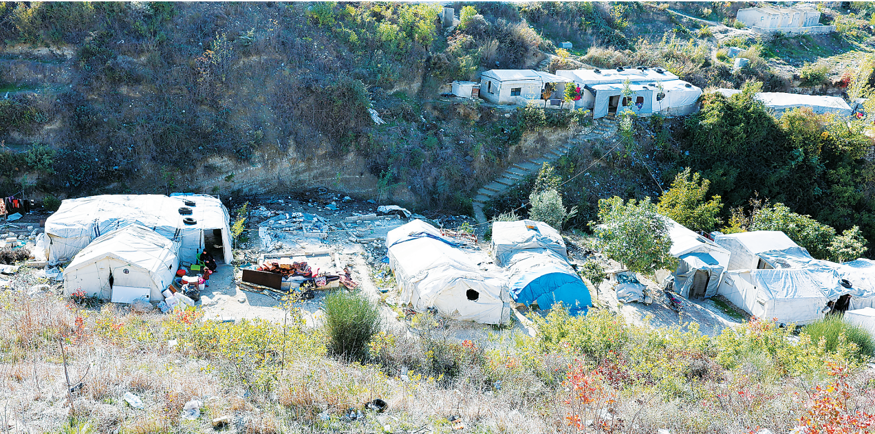
这是11月20日在叙利亚西北部伊德利卜省希尔拜米兹难民营内拍摄的临时帐篷。

先,尖锐批评欧洲。 在乌克兰问题上,报告提出要通过谈判迅速结束乌克兰危机,称美国需要“重建与俄罗斯的战略稳定”,以及“终结北约作为永久扩张联盟的认知”。报告还指责欧盟阻挠美国结束乌克兰危机的努力。 舆论认为,围绕对俄政策,新版美国国安战略标志着美国战略的重大变化。 自2014年俄罗斯兼并克里米亚及2022年俄乌冲突爆发以来,美国的战略文件始终将俄罗斯列为主要威胁。但在“特朗普2.0”时期,美国政府对俄态度有所缓和,呼吁与俄方开展有限合作。 当前,白宫正再次推动乌克兰和平进程,美国官员称他们正处于达成协议的最后阶段。然而,目前还没有迹象表明乌克兰或俄罗斯愿意签署特朗普谈判团队起草的框架协议。 对美国新版国安战略报告感到“扎心”的欧洲方面则在密切关注事态进展,担忧美国措辞的软化将削弱其对抗莫斯科的努力。