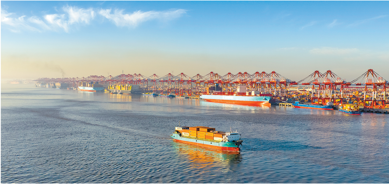
近日,洋山港呈现一片繁忙的景象。