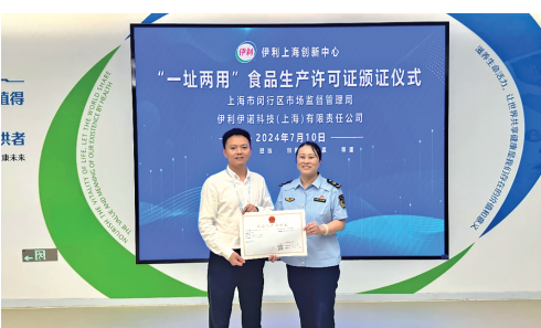
闵行区市场监管局为伊利伊诺科技(上海)有限责任公司颁发“一址两用”食品生产许可证。