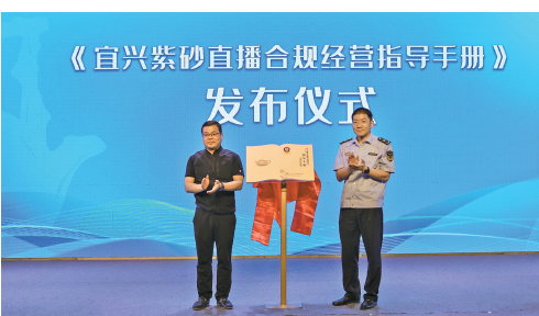
江苏省市场监管部门发布《宜兴紫砂直播合规经营指导手册》。

法的动机被质疑，被认为主要目的是创造罚款收入，而不是维护法律秩序；又比如，有些异地执法存在选择性执法，“撒网”之后抓谁不抓谁，可能缺乏统一标准。此外，还有不少异地执法面临程序正义问题，比如管辖权争议、扰民争议。 因此，有人将不规范的异地执法称作“远洋捕捞”式执法，“远洋”是指执法往往跑到辖区外很远的地方，“捕捞”则指可能没有明确的单个目标对象，而是针对某一类普遍存在的违法行为进行撒网式排查。 为解决跨区域执法标准不一的问题，2023年11月，全国首个跨行政区域、跨部门的“双随机、一公开”联合监管团体标准发布，率先统一了长三角一体化发展示范区内联合检查的基本流程与要求。 随后，《长三角地区市场监管行政执法取证规则》《长三角地区市场监管部门打击侵权假冒执法协作框架协议》《严格规范长三角地区市场监管异地执法行为八项举措》等文件相继落地，安徽省市场监管局率先出台市场监管领域轻微违法行为不予处罚和从轻减轻处罚规定，从操作层面进一步规范了执法取证行为。在2024年的电动自行车专项治理行动中，三省一市市场