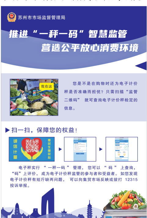
苏州市市场监管局“一秤一码”智慧监管。

区及相关省市上下游能源企业、检测机构、标准服务机构等，共同组建“逆向物流与低碳供应链标准创新联合体”，率先在区域内开展现状调研和标准研制工作。