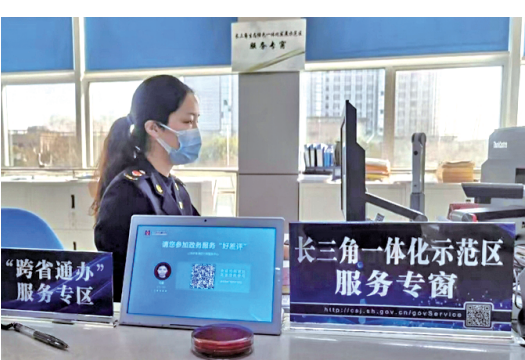
长三角一体化示范区服务专窗。