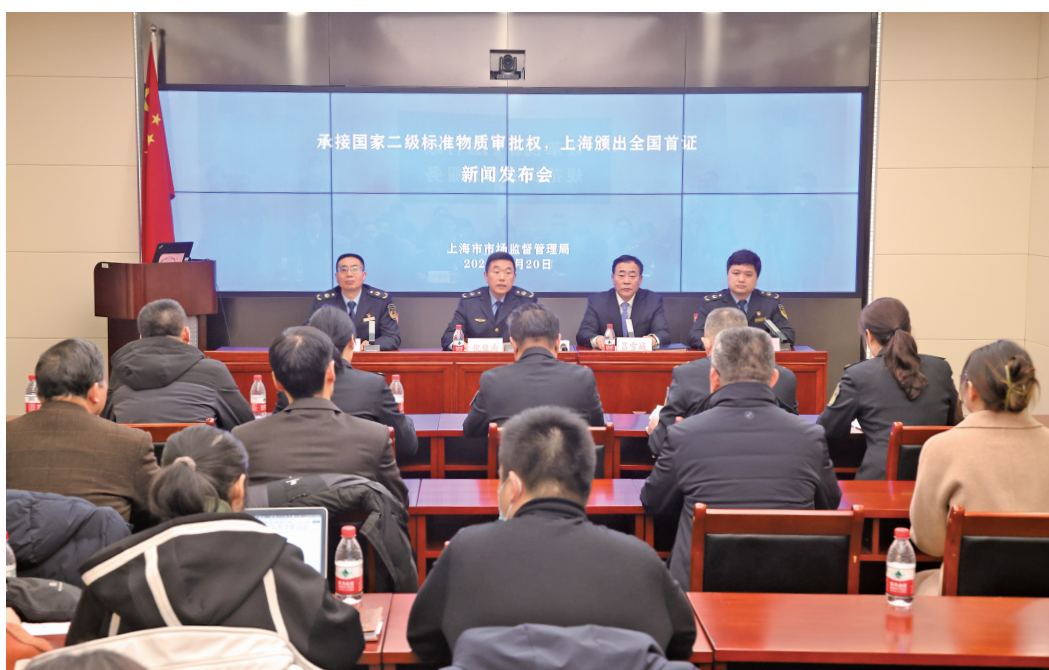
上海市市场监管局召开承接国家二级标准物质审批权新闻发布会。