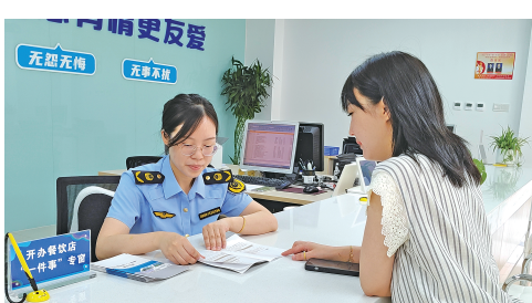
上海各区设置开办“餐饮店一件事”专窗，市场监管部门提供咨询、指导和帮办等服务。