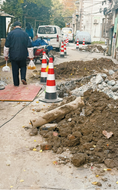
延吉四村路面铺设木板供居民通行。

告诉记者,这是他居住的小区今年第二次施工,距离上次施工结束还不到半年。在殷行街道国和一村小区,记者注意到,被挖开的路面、花坛土和一楼居民家门口连成一片,居民晾晒的衣服上沾满尘土。小区施工区域放置的一块文明施工告示牌上虽写着“施工区域采用活动式围挡与非施工区域严格隔离”,但实际上,多处正在开挖或无人看管的施工区域并未作出分隔,挖出的渣土也没有及时清理。