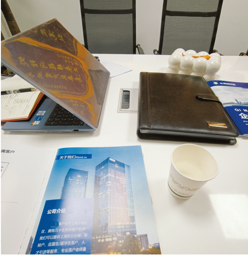
一家落户中介机构介绍“快捷落户”流程。

“这是不是挂靠社保?会不会有风险?”面对询问,工作人员摆手称:“我们做的不是挂靠,我们是做全套。你放心。”记者追问什么叫“全套”,对方开始逐条解释:“工资我们会按照高新企业标准给你发,在个税里能查到;劳动