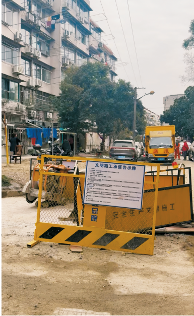
国和一村一内设有“文明施工承诺告示牌”。

告诉记者,这是他居住的小区今年第二次施工,距离上次施工结束还不到半年。在殷行街道国和一村小区,记者注意到,被挖开的路面、花坛土和一楼居民家门口连成一片,居民晾晒的衣服上沾满尘土。小区施工区域放置的一块文明施工告示牌上虽写着“施工区域采用活动式围挡与非施工区域严格隔离”,但实际上,多处正在开挖或无人看管的施工区域并未作出分隔,挖出的渣土也没有及时清理。