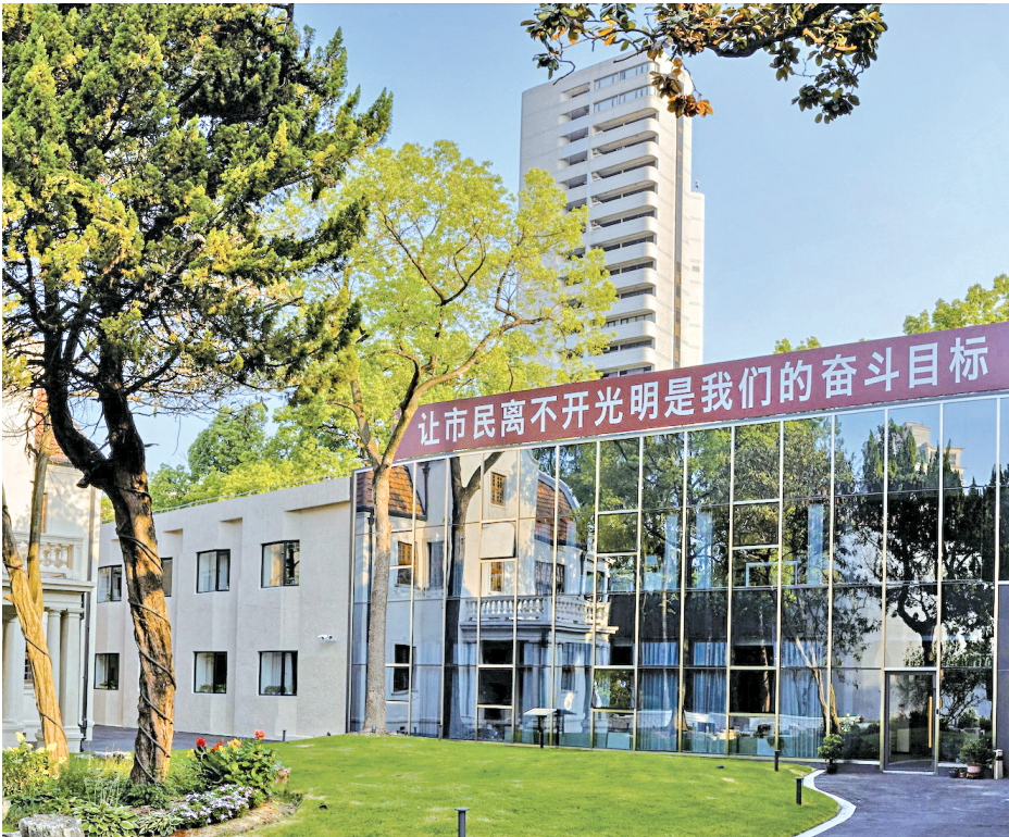
▲光明食品集团持续以“让市民离不开光明”为奋斗目标，紧跟城市发展脉搏，布局民生服务新场景。

守牢民生保障底线的同时，光明食品集团也在推动产业向“高精尖”突破，以科技创新与模式革新实现从“跟跑”到“并跑”乃至“领跑”