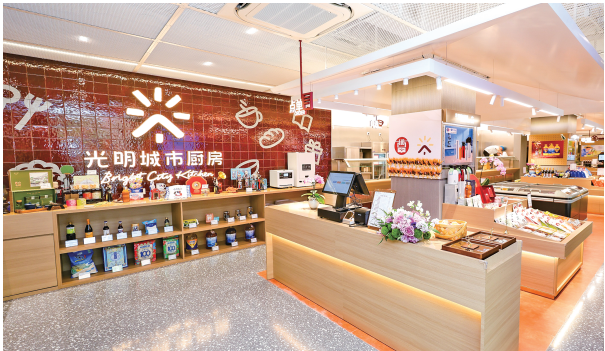
▲光明食品集团着力打造“产业+服务”融合共生生态，光明城市厨房正是这一理念的生动实践。

“过去种花靠经验，现在种花看数据，偌大的温室里几乎空无一人，却能养出数十万盆高品质红掌。”上花集团工作人员说。在上海鲜花