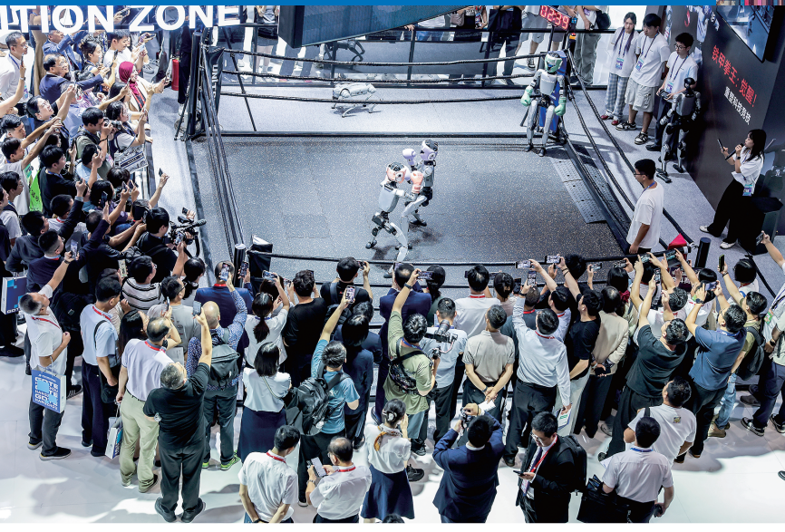
▲在杭州的第四届全球数字贸易博览会，观众观看宇树机器人格斗。新华社发 ▶位于安徽合肥的大众安徽模块化电驱平台工厂车身车间一角。新华社发