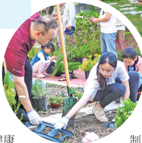
▲ “熟人社区”花园种植

西渡拥有23.31平方公里郊野地区，但这里的乡村振兴，不是整齐划一的模板复制，而是一幅因地制宜、各展所长的“八美图”。