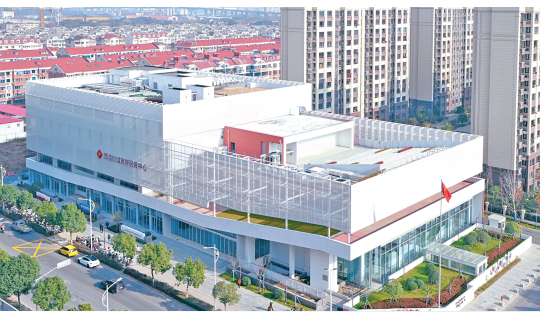
▲ 浦江第一湾市民中心