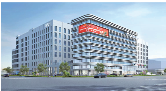
▲ 和汇集团“工业上楼”效果图

产业，是区域发展的脊梁。对于西渡而言，产业升级是一场与土地约束的博弈，更是一次面向未来的主动选择。