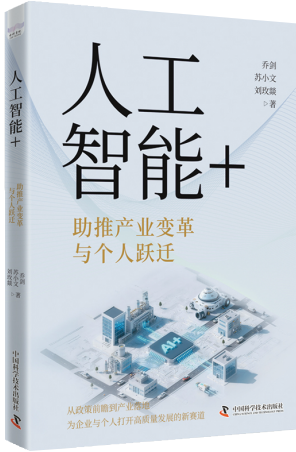
《人工智能+：助推产业变革与个人跃迁》 乔剑 苏小文 刘政姝 著 中国科学技术出版社

面对这些变革，个体如何把握机遇？本书专门探讨了“个人机遇”的话题，通过分析AI催生的新职业图谱、创业与副业方向，以及普通人可掌握的AI工具与应用思维，为读者提供了“拥抱时代”的具体路径，消除了人们对技术替代的焦虑，传递了“人与AI协同共生”的核心理念。