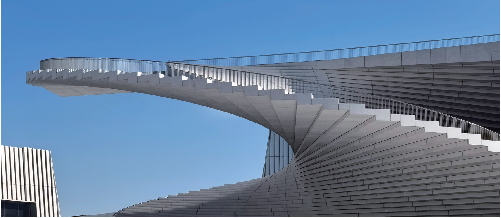
螺旋形阶梯延续到了剧院内每一处空间,形成自然过渡。