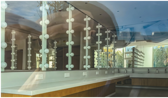
装饰一新的后台化妆间。