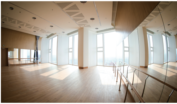
完成装修的舞蹈排练厅静待演员的到来。