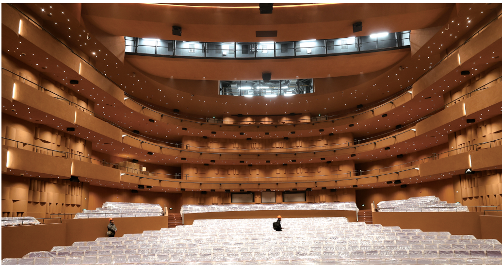
1200座的中歌剧院聚焦先锋实验性剧目。