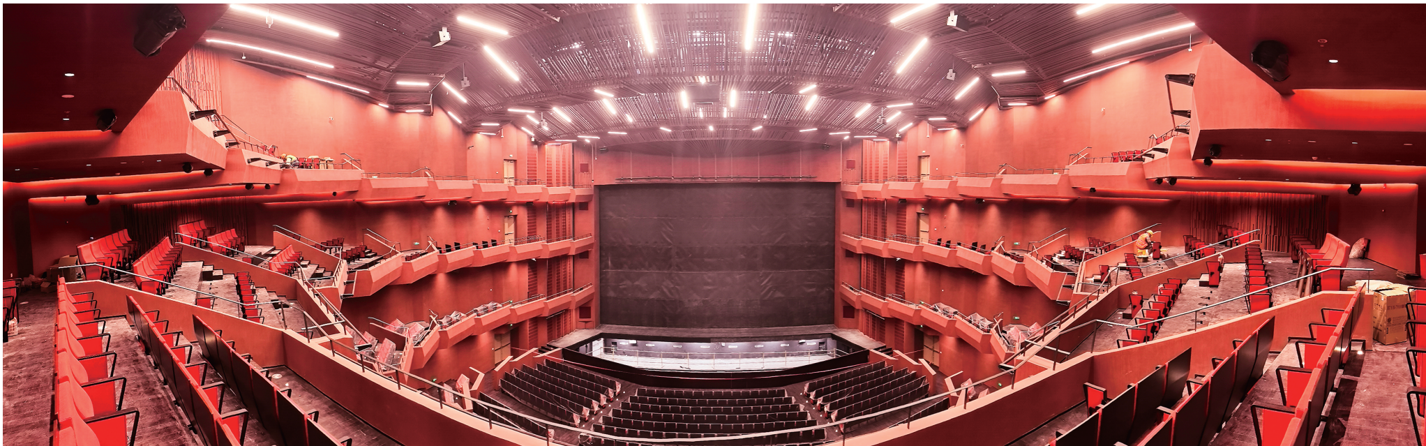
室内三个核心剧场能够匹配不同演出类型。其中,2000座的大歌剧院专门用于呈现世界级经典歌剧。