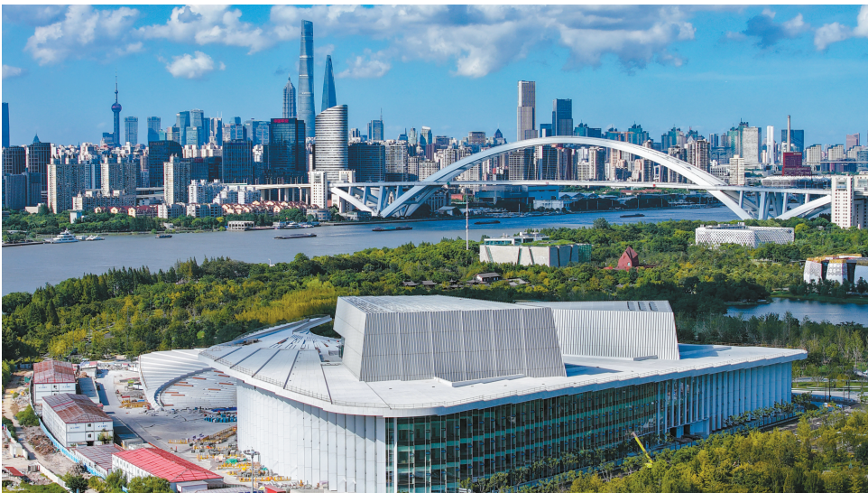
上海大歌剧院与陆家嘴天际线建筑群遥遥相望,自成风景。