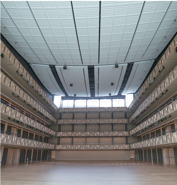
1000座的沉浸式小剧场,主打互动感十足的情景演出。