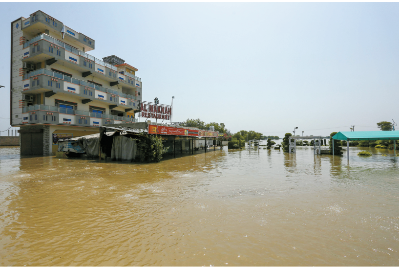
这是9月在巴基斯坦旁遮普省拍摄的遭洪水侵袭的区域。

此后数十年，这份条约成了少数能“穿越战火”的制度性安排：即便两次印巴战争、多次边境冲突，条约运