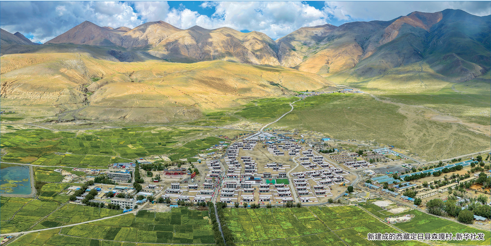
新建成的西藏定日县森嘎村。