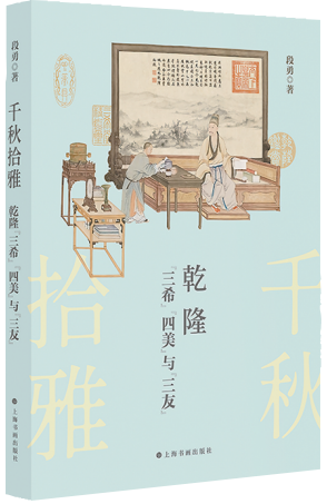
《千秋拾雅：乾隆“三希”“四美”与“三友”》 段勇 著 上海书画出版社

纵观全书，散布于紫禁城空间的文物与场景，超越了在传统艺术收藏、宫廷、建筑等领域孤立研究的范畴：三希堂的墨香、四美具的画意与三友轩的诗韵，在紫禁城中形成交融共生的文化图景。郑欣淼先生提出的故宫学核心要义，在于打破中国近代参照西方划分的艺术史、建筑史等领域之间的学科壁垒，以整体性思维把握故宫作为文化整体的本质属性。段勇教授所著的《千秋拾雅：乾隆“三希”“四美”与“三友”》(以下简称《千秋拾雅》)恰是该理念的实践典范，他以三组十件藏品为研究切入点，在文物与空间的互文关系中，阐释故宫文化的深层逻辑，为故宫学研究提供了具有重要价值的实践范式。