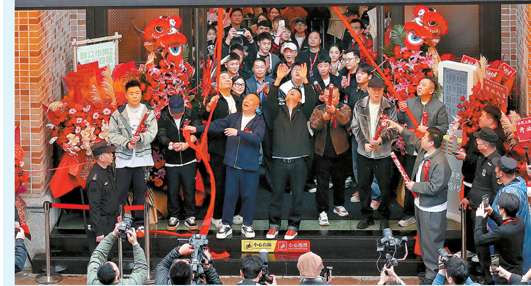
上海德云社开业庆典演出节目单。