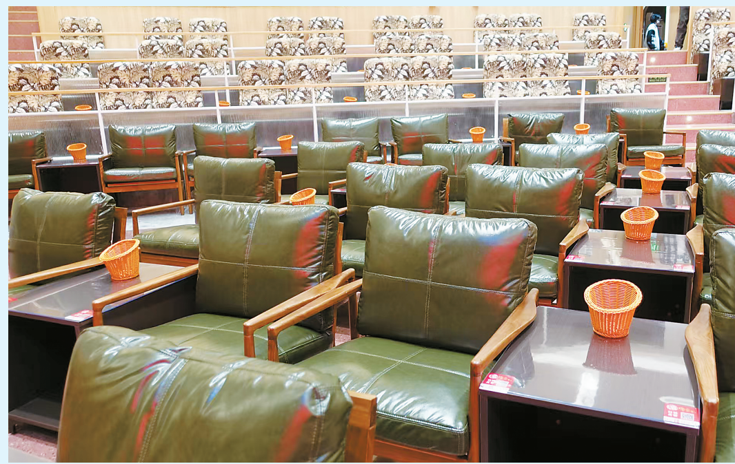
剧场内共317个席位,沙发配茶几,还设有包厢。