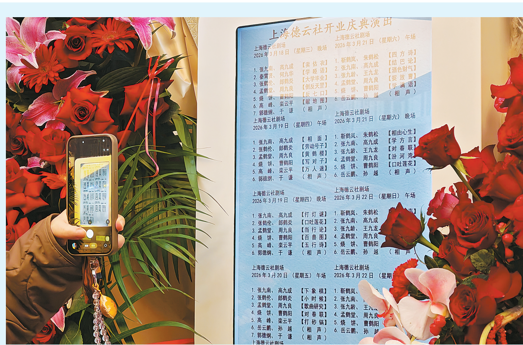
上海德云社开业庆典演出节目单。