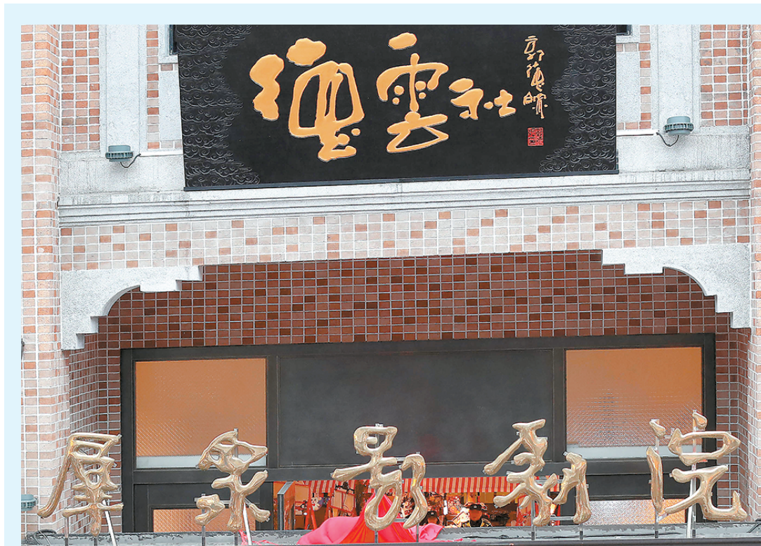
昨天,郭德纲、于谦带领一众弟子为德云社上海分社揭牌。

85后叶女士在大麦网抢到本周日晚两场588元的演出票,“周四的票,刚打开网站就没了,周五的票进