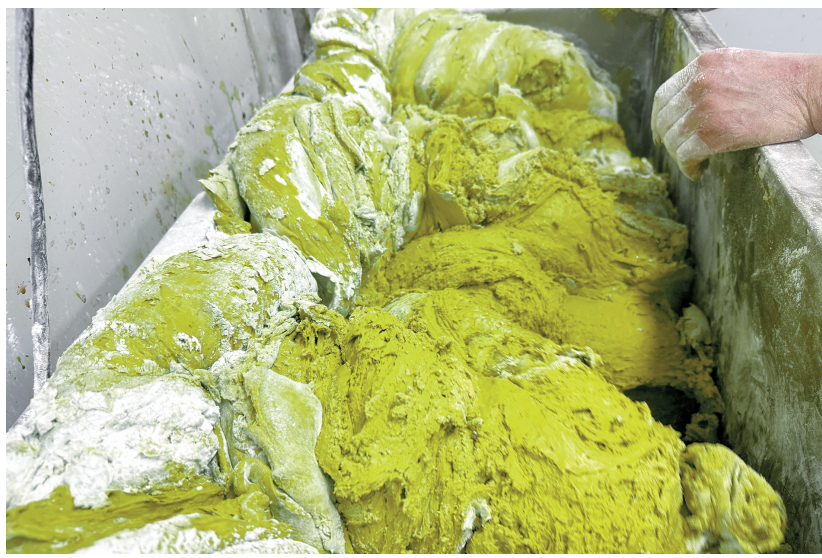
青团的青色来自天然植物。