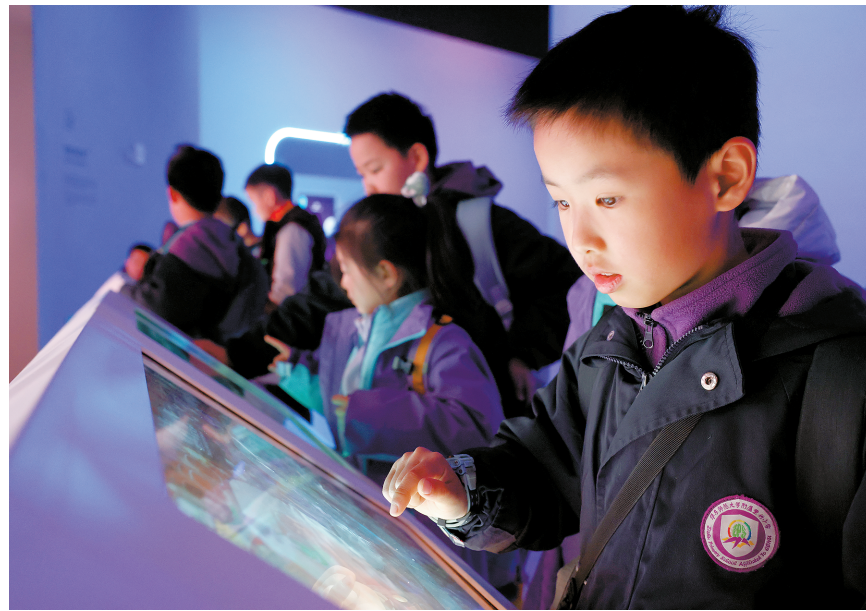
在上海科技馆内,小朋友在游戏互动中学习科技知识。

3月17日,国家发展改革委、国务院妇儿工委办公室发布《关于在全社会推进儿童友好建设的意见》,其中提到鼓励放宽儿童免票身年龄限制等举措。