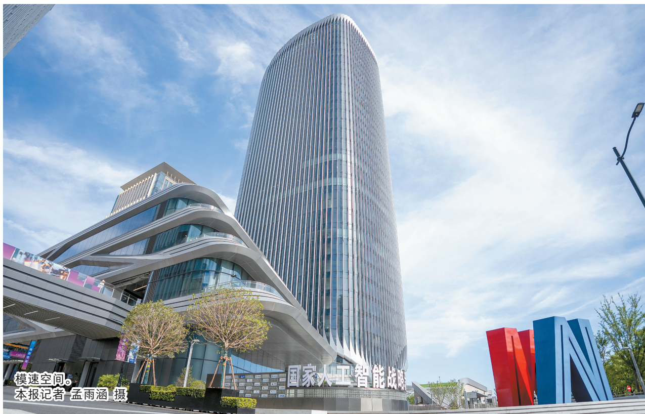
模速空间。

习近平总书记在开班式上明确指出,建设现代化产业体系、实现产业体系整体跃升,是“十五五”时期的重要战略任务。