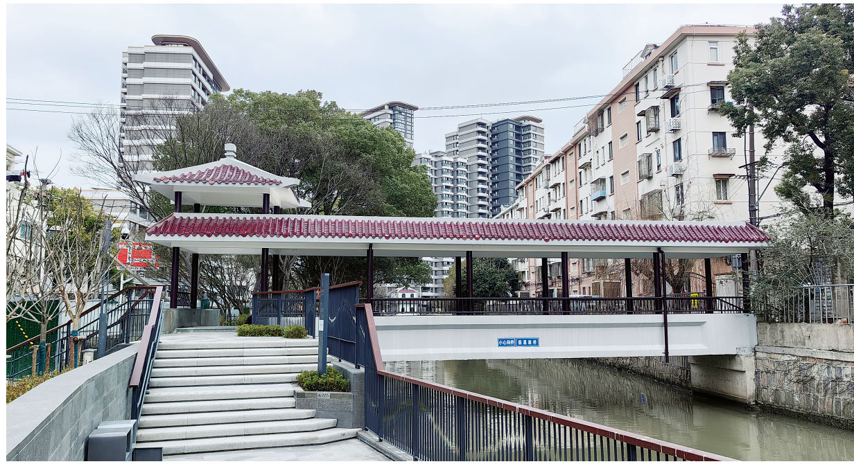
现市河上的韶嘉桥