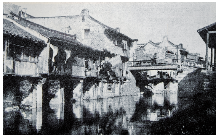
清末江湾镇市河及桥梁