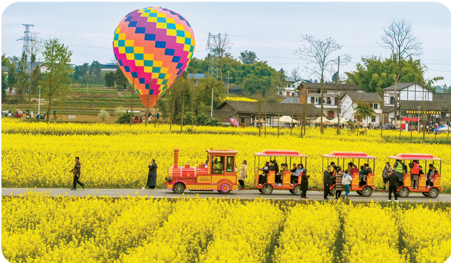
春分的到来意味着万物复苏,春意盎然。图为游客在四川广安的油菜花田间赏花游玩。

春分时节,花粉过敏者需警惕,要注意选择春游地点,应尽量回避有花之处,出行前要准备抗过敏药物,预防严重过敏对身体带来的危害。另外,不要随便采集不认识的野菜(包括蘑菇)、野果,以防食物中毒。食物尽量煮熟食用,避免进食生冷食物,防止病从口入。