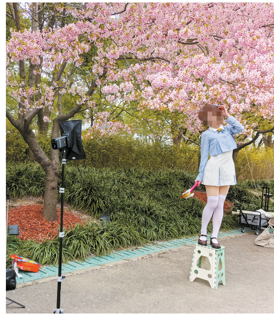
近日,顾村公园樱花绽放,成为拍照打卡热门地。众多摄影爱好者带着各类装备齐聚于此:补光灯、闪光灯、反光板一应俱全。各类商拍长时间“霸占”美景,不少市民无奈吐槽,“几乎每棵树都被商拍占据,游园体验大打折扣。”

Tao:建议明确商拍注册制、预约制,制定相应管理措施,这样对任何违规都能进行处罚,任何随意不预约不注册的商拍行为,按照规定进行罚款。