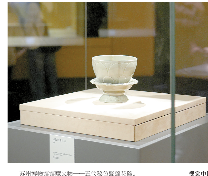
苏州博物馆馆藏文物——五代秘色瓷莲花碗。