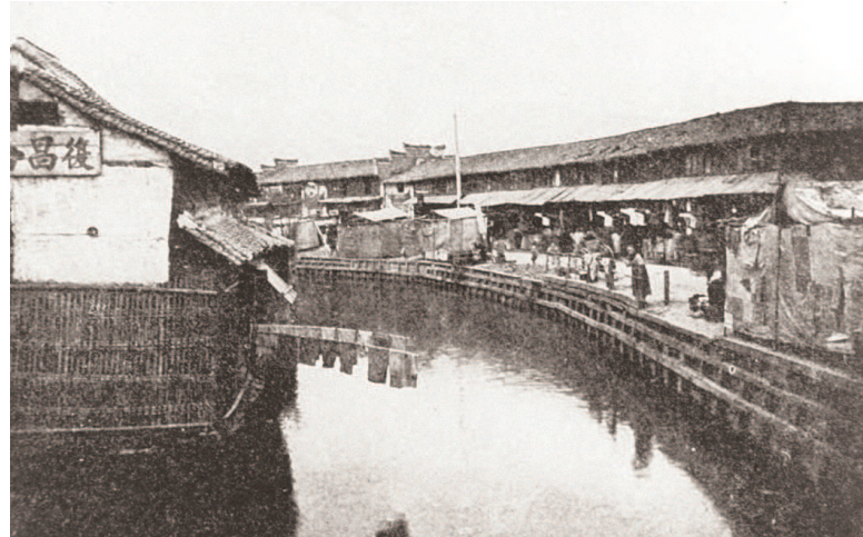
老城厢护城河一角

消失的城濠，早已融入上海的城市血脉，成为理解上海“从哪里来、到哪里去”的关键线索。上海的城市变迁，正是在这样的兴废与传承中，不断书写新的篇章。