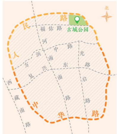
环绕老城厢区域的护城河示意图 金涛 制图

东南望族、老上海士绅顾从礼(以善书法被荐，授中书舍人，后官至太仆寺丞、光禄寺少卿，加四品服，以81岁高龄葬日晖港北大仓[今打浦桥地区])上奏朝廷：“今编户六百余里，殷实家多在市，钱粮四十万余……货物尤多，而县外不过一里即黄浦，潮势迅急，最难防御……盖贼自海入，乘潮劫掠，如取囊中，皆由无城之故”，要求朝廷“转念钱粮之难聚，百姓之哀苦”，迅速“开筑城垣，以为经久可守之计”。