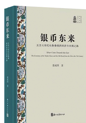
《银币东来：五至七世纪吐鲁番绿洲经济与丝绸之路》裴成国 著 浙江古籍出版社