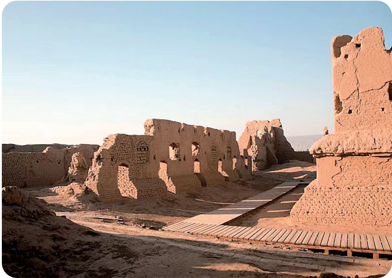
高昌古城遗址，位于今新疆吐鲁番市高昌区。 资料图片