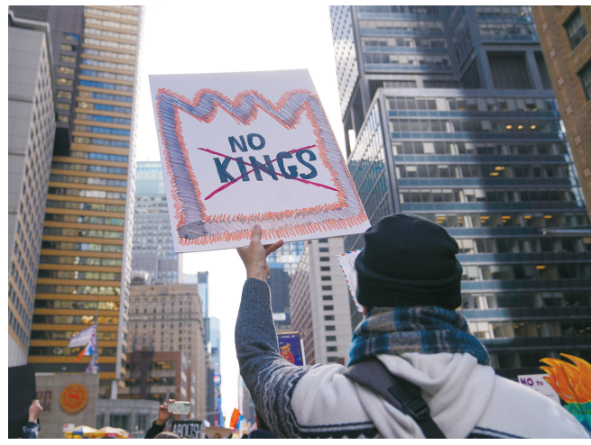
3月28日,在美国纽约,抗议者手举“不要国王”标语牌。

据新华社纽约3月28日电 综合新华社驻纽约、华盛顿、洛杉矶、旧金山等地记者报道:美国多地28日爆发示威抗议活动。数百万民众走上街头,针对特朗普政府的移民执法等一系列政策表达不满,呼吁结束对伊朗的军事打击。