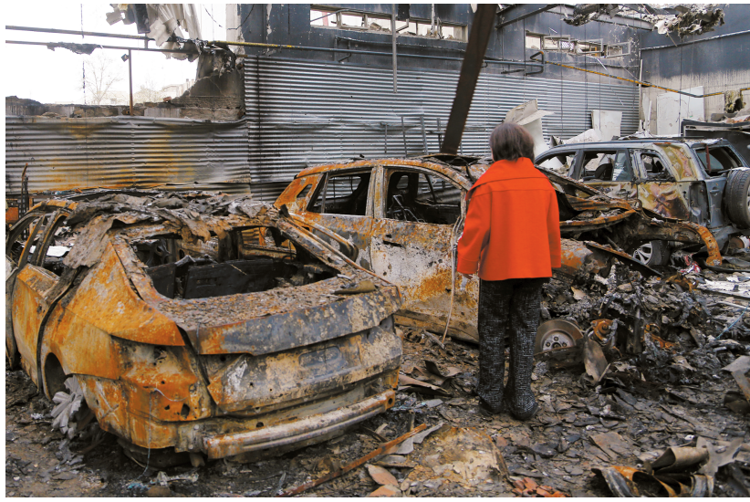
3月28日,一名女子在伊朗德黑兰一处被损毁的汽车服务中心查看车辆残骸,该地在美以军事行动中遭受导弹袭击。 新华社发

在关键的时间节点上,多重角色纷纷登场,成为塑造战局的新变量——美国海军陆战队首批增援部队抵达中东;被视为伊朗另一张“王牌”的也门胡塞武装参战;巴基斯坦等斡旋方继续外交发力,开辟和谈空间。激战至第二个月,这场冲突将往何处去?是走“上行线”直至“失控决口”,还是走“下坡路”通往“安全出口”?