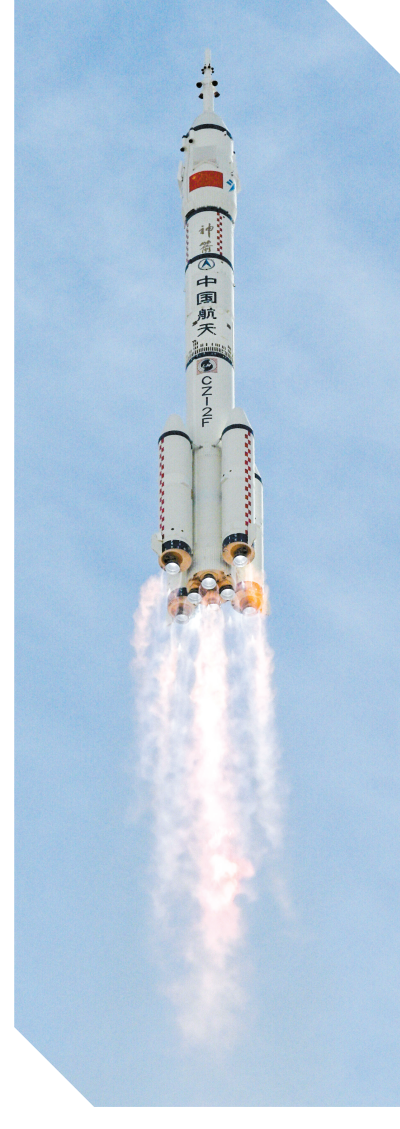
2025年11月,神舟二十二号飞船发射取得圆满成功。

月月和载人月球车名称确定,登月服命名为“望宇”,载人月球车命名为“探索”。在中国航天器的命名征途中,这种当代科技与历史人文的交融,反映了新时代航天人和国民对中华文明和中国文化的自信与自豪。目前,业界对星际航行的定义尚无定论,但随着深空探测、地月空间探测等研究走向深入,人类迈向星际航行、奔赴更遥远宇宙探索未知边界是必然趋势。人类文明的星际未来,正一步步从想象走向现实。科学家此刻研制的,是如何打造驶向月球、登陆火星的飞船等,他们心中不灭的向往是让人类的足迹遍布银河,让文明的星火在更遥远的星空恒久闪耀。