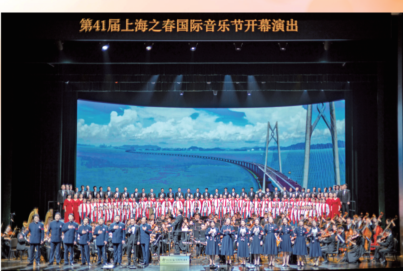
“永恒的征途”——纪念红军长征胜利90周年主题音乐会。