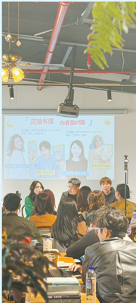
书屋开业当日,青年作家对谈活动在店内举办。