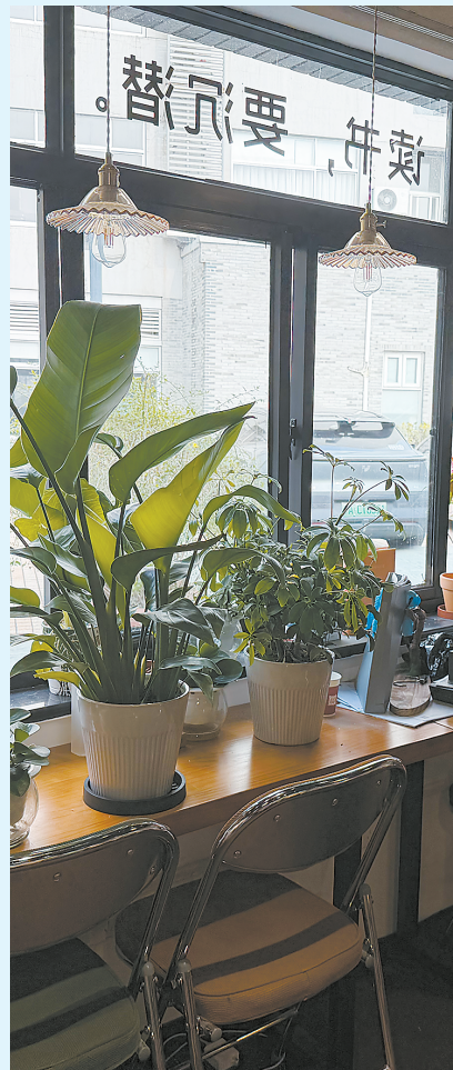
沉潜书屋长宁店一角,窗户上贴着“读书,要沉潜”。