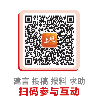
建言 投稿 爆料 求助 扫码参与互动