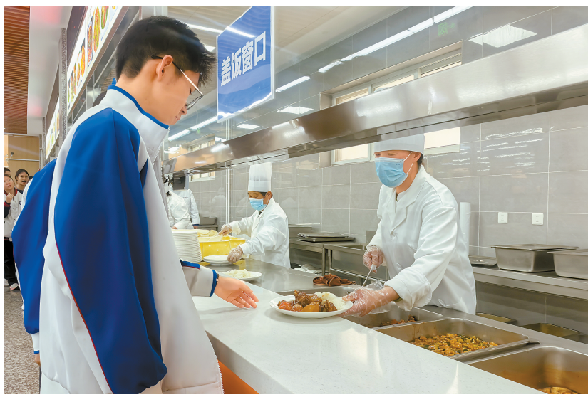
图为学生在海淀实验中学食堂就餐。