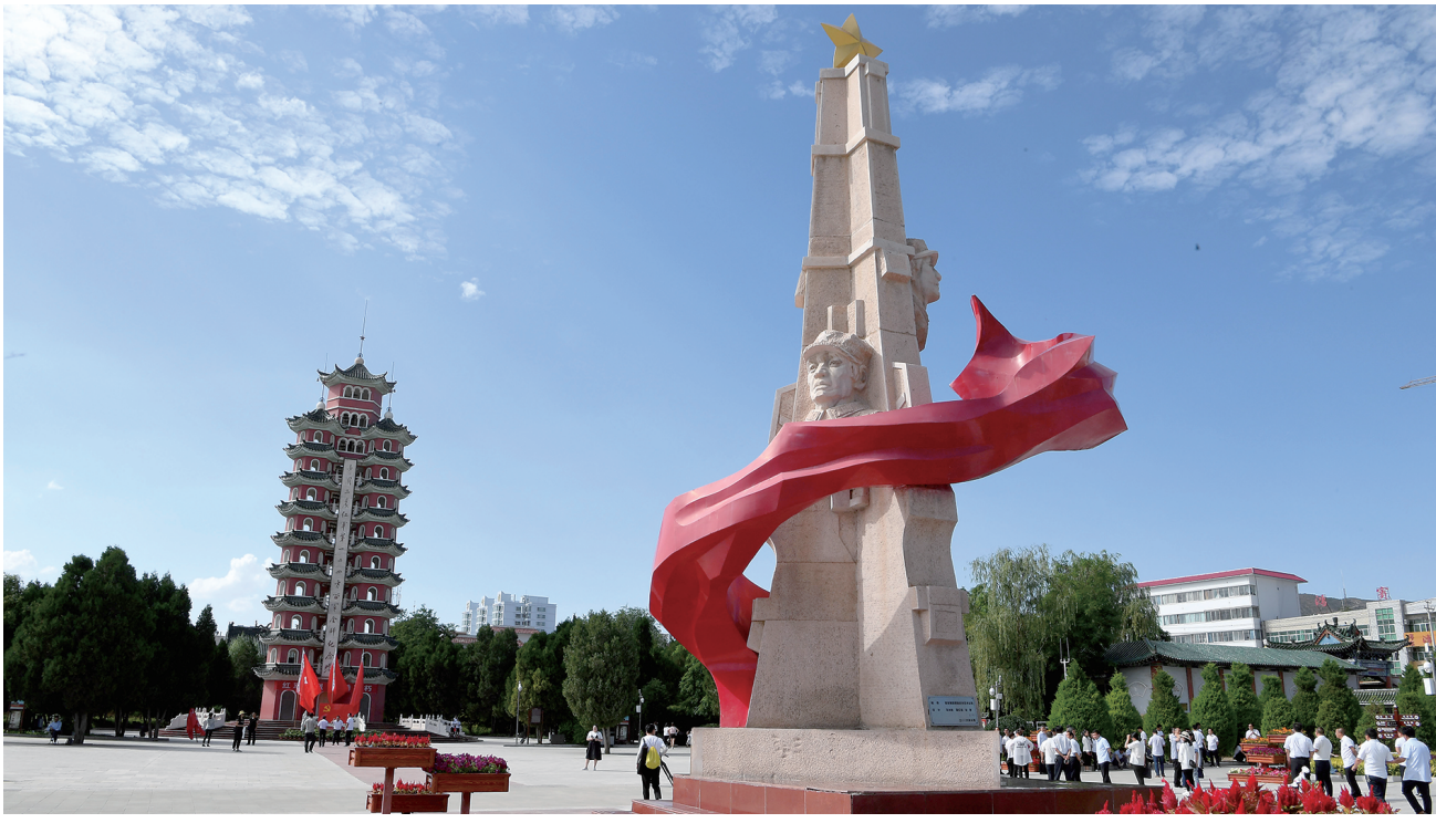
甘肃会宁县红军会宁会师旧址雕塑和会师纪念馆塔。