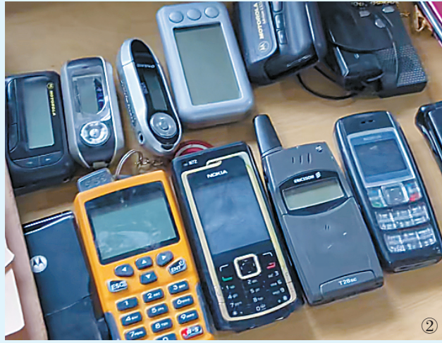
① 变瑟龙影视基地位于闵行区马桥镇,其二楼的中古道具展厅就是最近走红的变瑟龙博物馆。 ② 博物馆收藏的多款老式手机和BP机。 ③ 博物馆内陈列的各式乐器和电器。