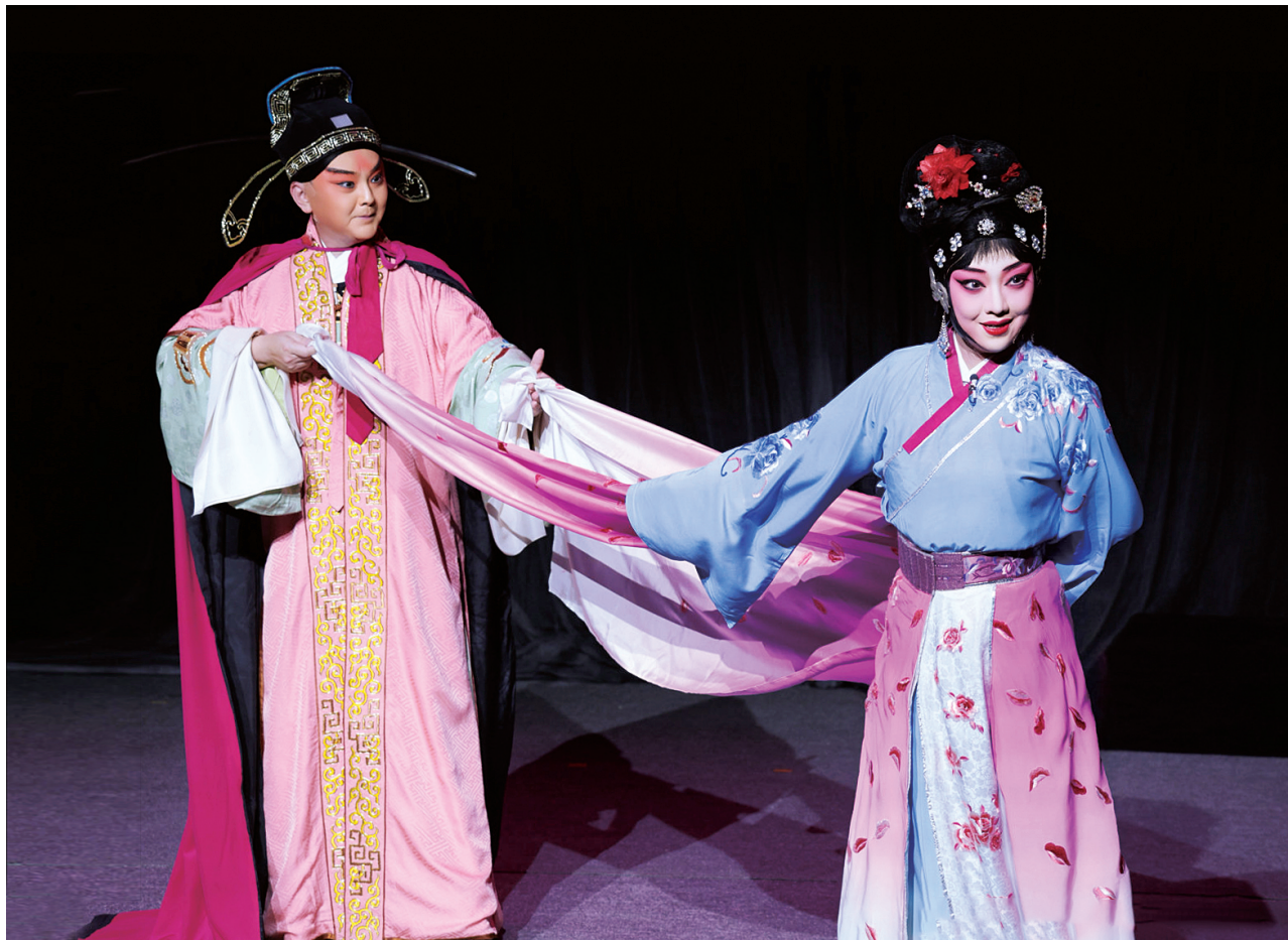
京剧《马前泼水》演出剧照

一部成功的作品带来的首先是观念革新，这一点毋庸置疑。许多时候，行业的眼界豁然开朗，就在于一