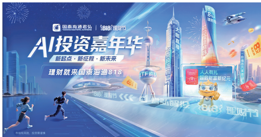
“818理财节”由国泰海通在行业内首倡发起，已成为全行业共同参与的财富管理年度盛事。2025年8月，国泰海通举办合并成立后首届“818理财节”，推出行业首个全AI智能App国泰海通灵犀，打造行业财富管理领域首个“AI投资嘉年华”。