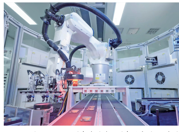
2026年1月22日，国泰海通旗下国泰君安国际、海通国际携手助力上海龙旗科技股份有限公司在港交所主板上市。龙旗科技是全球领先的智能产品和服务提供商，因为该公司产线实景。

稳健的资本实力，截至2025年末，公司合并总资产突破2.1万亿元，归母净资产超3300亿元，资本实力跻身行业最前列，资产结构更趋均衡、韧性显著增强。