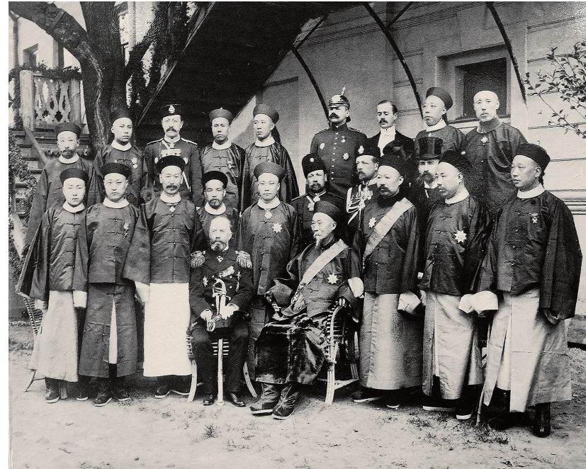
李鸿章故居展出的李鸿章及随从与沙俄军官合影。视觉中国 供图

而回过头看李鸿章的这段“西游记”，他在出访中面对的诸多问题——如中美在劳动力、职业市场等方面的矛盾以及《排华法案》——在今天的全球化时代，仍以不同形式反复出现。李鸿章能运用当时最先进的经济学理论展开论辩，这一点提醒我们：在当今的国际交往与博弈中，我们同样需要掌握前沿的社会科学理论，在此基础上清晰发出自己的声音，以理服人。