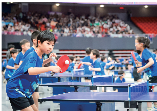
上海乒乓球嘉年华打造全龄参与的体育盛会。