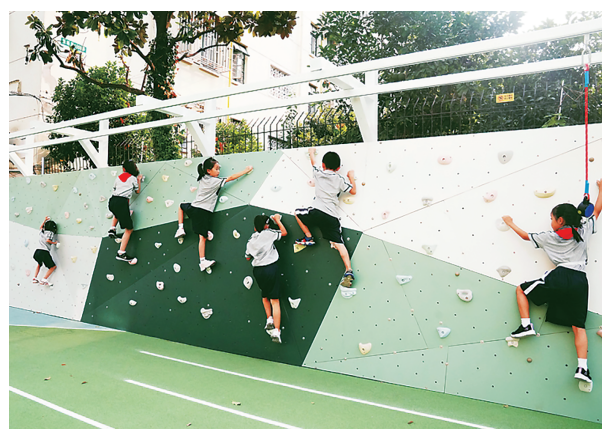
竹园小学的攀岩墙成为孩子们的乐园。

这学期,每天13时30分至14时30分,是普陀区洵阳路小学低年级学生的第三段“乐活运动”时间。趣味体能游戏,是学生最期待的环节。吹气球大王挑战、抛花球大赛、足球绕杆射门、足球九宫格射门、平板支撑大王、一分钟跳绳、纵跳摸高、冰壶……学校准备了100多种包括趣味体能、灵敏活动在内的多项游戏,每天都有新玩法。下转▶4版