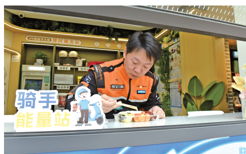
网约配送员在半马苏河驿站·1690党群服务中心的“骑手驿站”休息用餐。

从“居高司机之家”到“货车司机党群服务站”，再到面向骑手群体的“和欣公寓”等安居项目——无论是车轮上的司机还是穿梭街巷的骑手，都能在普陀找到安稳的落脚点。“十四五”期间，普陀累计提供“新时代城市建设者管理者之家”近3000张床位，一张张床位的背后，是一座城区对新就业群体最朴素的承诺：