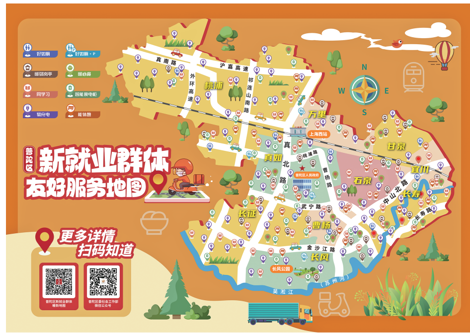
普陀区新就业群体友好服务地图

健康关怀同样没有缺口。2026年，普陀区面向网约配送员、快递员、网约车司机等群体全面开通家庭医生签约服务，全区12家社区卫生服务中心均可办理，新就业群体有了专属“健康管理家”。心理健康层面，普陀区联动专业机构构建“可及、专业、温暖”的心理支持网络，提供24小时心理咨询热线和线下团体辅导，守护新就业群体的心理健康。