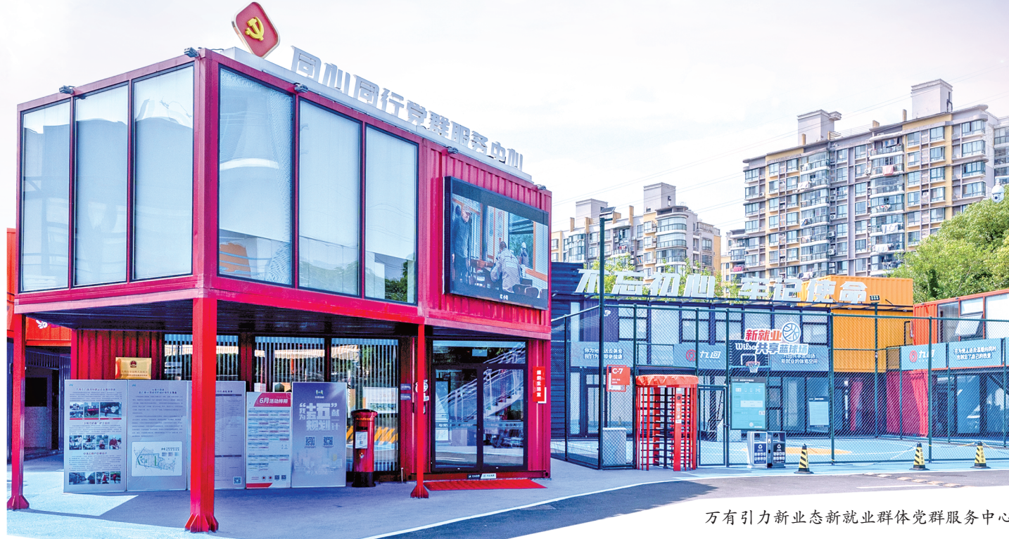
万有引力新业态新就业群体党群服务中心

作为上海中心城区之一，普陀区内集聚了网约配送员、网约车司机、货车司机、快递员等多个新业态领域从业者。如何把这个群体服务好、引导好，让他们真正融入城市、扎根城市？普陀区以党建为引领、以全域友好为底色、以双向奔赴为内核，探索出一条从“服务凝聚”到“治理融入”的新路径。