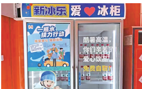
万有引力新业态新就业群体党群服务中心内设有爱“新”冰箱，为新就业群体提供“一瓶水”。