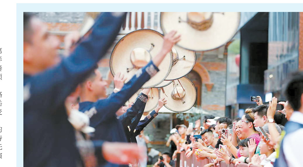
滨港·今潮8弄内热闹的演艺活动。