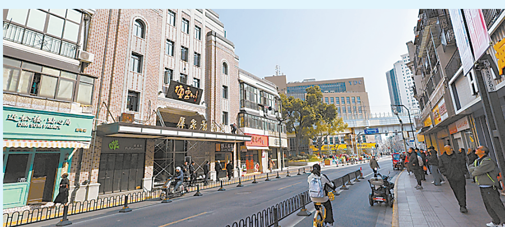
德云社上海剧场所在的群众影剧院。