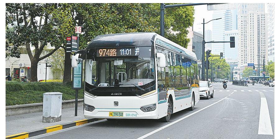
974 路公交试点显示发车时间。