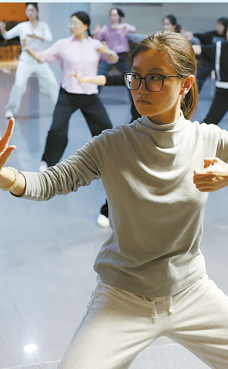
在上海市群众艺术馆市民艺术夜校，学员在打太极拳。

目前，“运营”的真实身份仍在进一步追查中。作为下游环节的杨某等6人被移送普陀检察院审查起诉。经查，杨某等人转移十余名被害人钱款共计人民币1.7万元。经普陀检察院提起公诉，法院以掩饰、隐瞒犯罪所得罪判处杨某、李某等人有期徒刑11个月至6个月不等，各并处罚金。