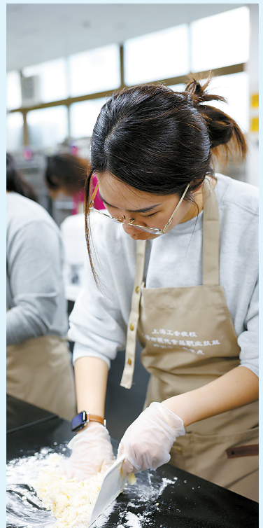
在上海市现代食品职业技能培训中心，学员动手制作西点。