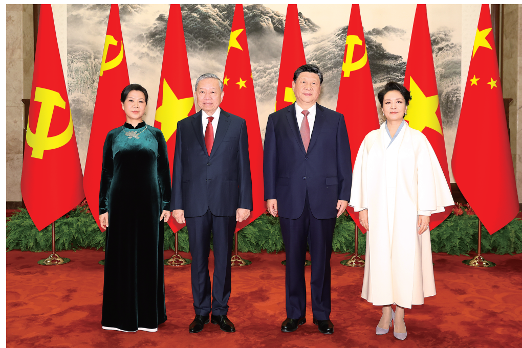
4月15日上午，中共中央总书记、国家主席习近平在北京人民大会堂同来华进行国事访问的越共中央总书记、国家主席苏林举行会谈。这是会谈前，习近平和夫人彭丽媛同苏林和夫人吴芳瑞合影。