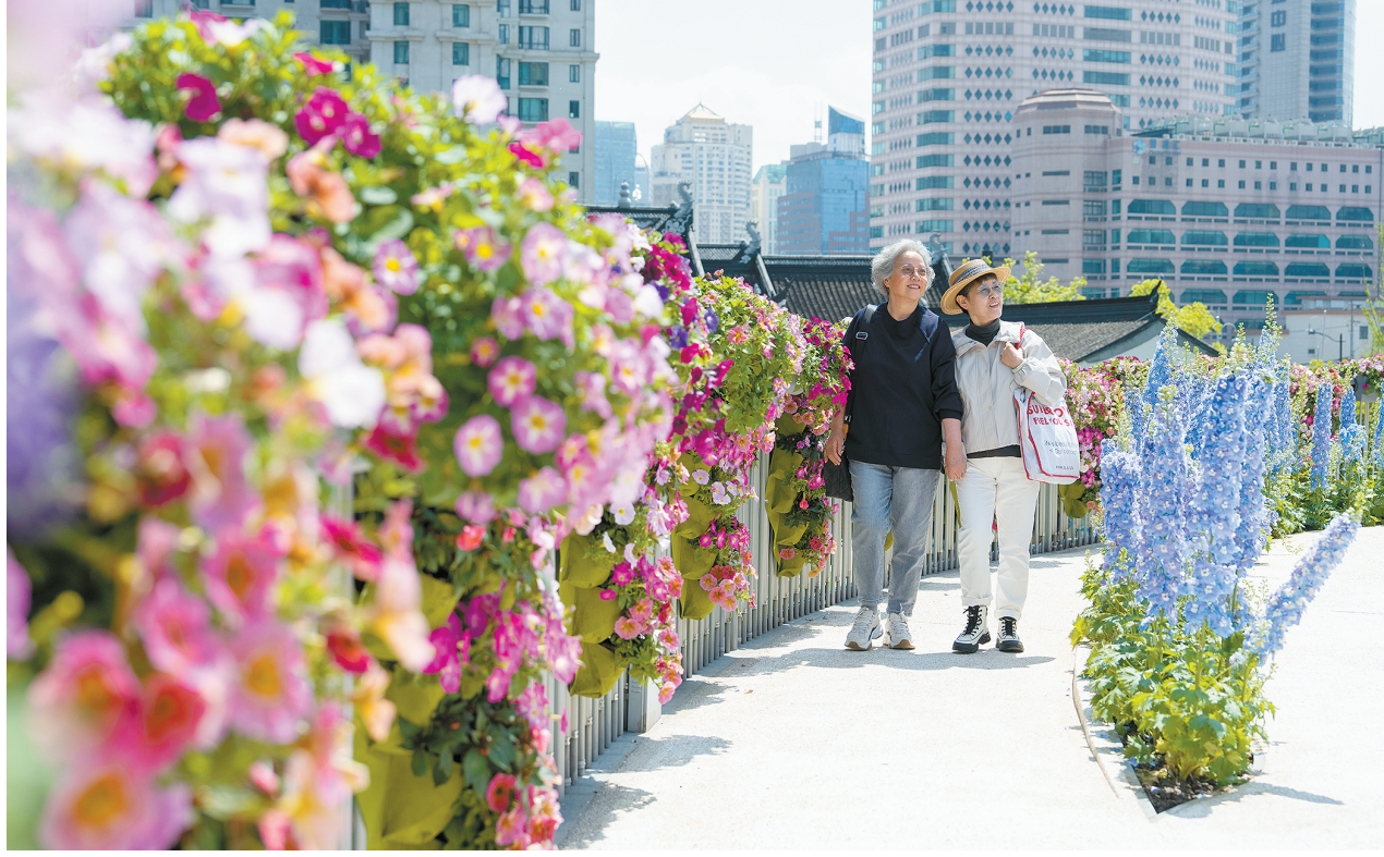
首届上海国际花卉节本周末开幕,苏河湾万象天地过街天桥被各类主题花卉精心装点。

记者了解到,“陪诊服务”之所以成为“香饽饽”,一来是年轻人认为这个岗位相对体面、轻松,二来收入也不错,企业开出的月薪在7500元到16000元。上海家嘉宁养老服务有限公司的摊位上贴出要招500名陪诊师的需求,工作人员陈先生拿着厚厚一摞简历介绍:“年龄要求要在22岁—45岁,大专以上学历,有爱心、有耐