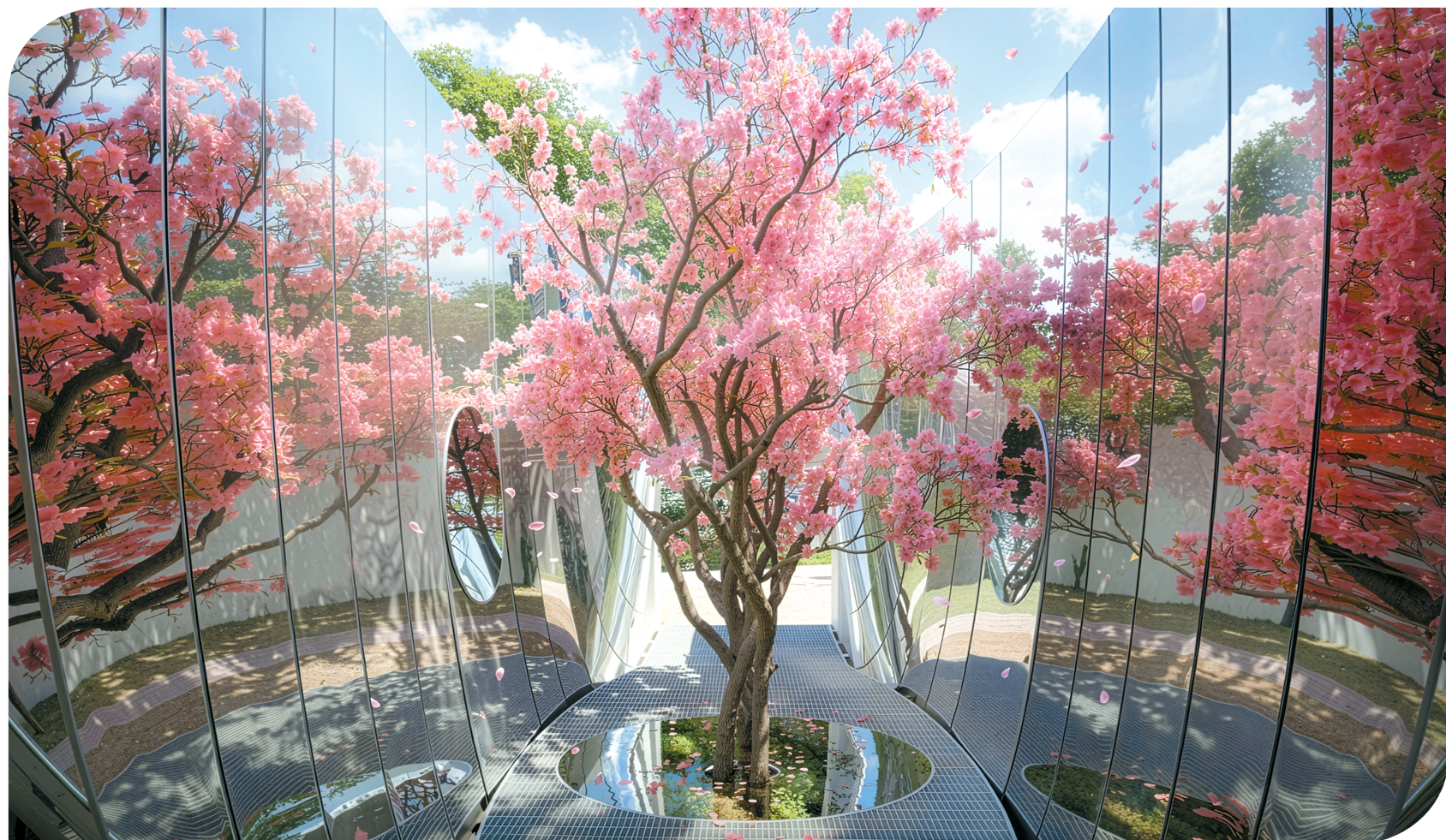
“一木千林”花园来自主理人板块,该板块募集了全球各行业的设计师,每位主理人负责一个花园主题。均受访者提供