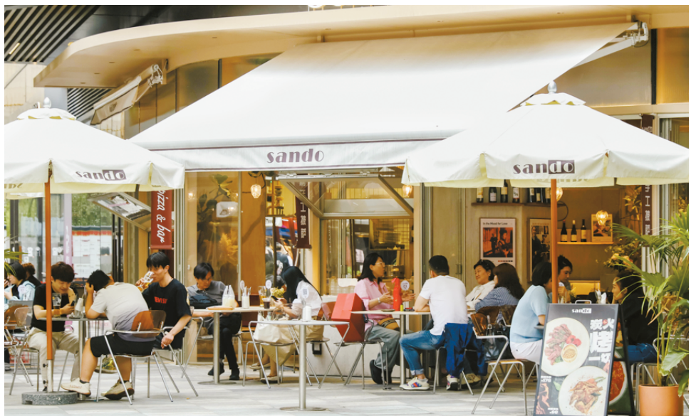
鸿寿坊里的外摆位生意红火。